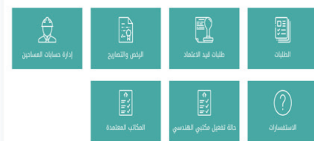
شكل رقم (13)

بعد التسجيل تظهر الأيقونات الخاصة بحساب المكتب الهندسي. أنظر للشكل رقم (13)