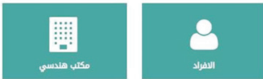
شكل رقم (6)