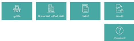
شكل رقم (8)

بعد التسجيل تظهر الأيقونات الخاصة بحساب المساح أنظر للشكل رقم (8)