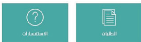
شكل رقم (4)

بعد التسجيل تظهر الأيقونات الخاصة بحساب المالك • أيقونة الطلبات : من خلالها يمكن متابعة الطلب. • أيقونة الإستفسارات : من خلالها يمكن الإستعلام عن ملاحظات الطلب أو أي إستفسار آخر حول فرز الوحدات العقارية أنظر للشكل رقم (4)